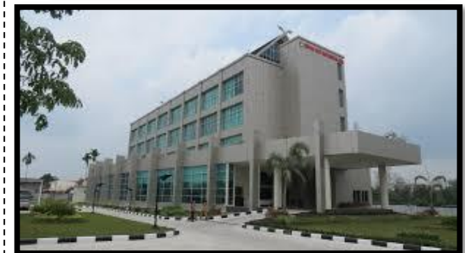
Gambar 1. Rumah Sakit Pendidikan Universitas Riau Kampus Bina Widya Panam Lt.III Pekanbaru - Riau